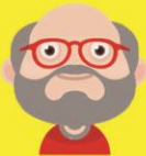
ผู้สูงอายุ