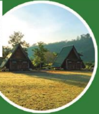
ส่วนป่าแม่ละเมา-แม่สอด จ.ตาก