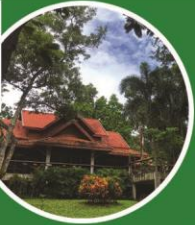
ส่วนป่าเขาระยาง จ.พิษณุโลก