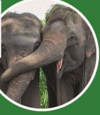
สถาบันคชบาลแห่งชาติ จ.ลำปาง