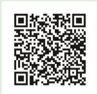
แบบประเมินความพึงพอใจวารสาร “เพื่อนป่า”