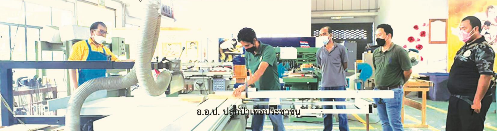
อ.ป. ปลุกป่าเพื่อประชาชน

สร้างเครือข่ายด้านการตลาด ในการนำผลิตภัณฑ์และไม้แปรรูปของ อ.ป. ไปเป็นวัตถุดิบในการผลิตเฟอร์นิเจอร์และเครื่องเรือน โดยมีผู้เข้าร่วมฝึกอบรม จำนวน 20 คน ณ สถาบันพัฒนาฝีมือแรงงาน 11 สุราษฎร์ธานี อำเภอเมืองสุราษฎร์ธานี จังหวัดสุราษฎร์ธานี