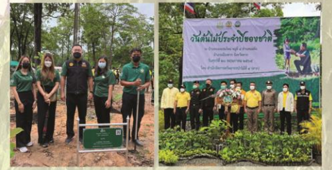
องค์การอุตสาหกรรมป่าไม้เขตตาก องค์การอุตสาหกรรมป่าไม้ภาคเหนือล่าง เข้าร่วมกิจกรรม ปลูกต้นไม้ เนื่องใน 'วันต้นไม้ประจำปีของชาติ' ณ เขตป่าสวนแห่งชาติ ป่าแม่ท้อและป่าห้วยตากฝั่งขวา อำเภอเมืองตาก จังหวัดตาก