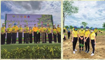
ผู้แทนองค์การอุตสาหกรรมป่าไม้ภาคเหนือล่าง เข้าร่วมกิจกรรมปลูกต้นไม้ เนื่องใน 'วันต้นไม้ประจำปีของชาติ' ณ บริเวณที่ราชพัสดุ อำเภอเกาะคา จังหวัดลำปาง