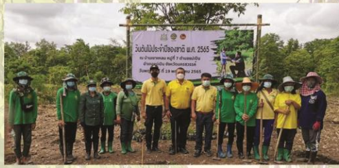
งานสวนป่าลาดยาว องค์การอุตสาหกรรมป่าไม้เขตตาก องค์การอุตสาหกรรมป่าไม้ภาคเหนือล่าง เข้าร่วมกิจกรรมปลูกต้นไม้ เนื่องใน 'วันต้นไม้ประจำปีของชาติ' ณ บริเวณบ้านเขาแหลม อำเภอแม่เปิน จังหวัดนครสวรรค์