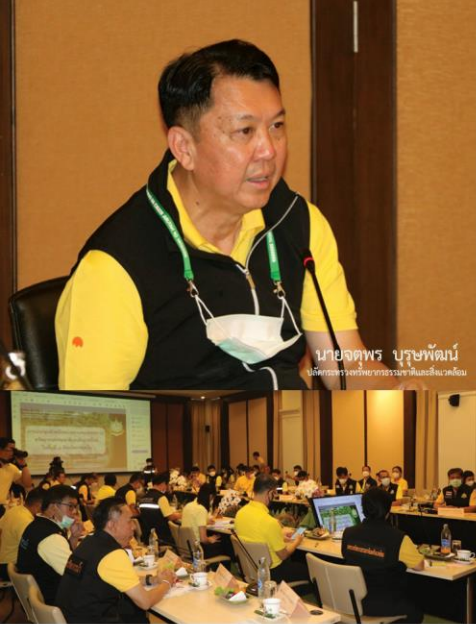
นายจตุพร บุรุษพัฒน์ รองผู้อำนวยการสำนักงานสิ่งแวดล้อมแห่งชาติและสิ่งแวดลอม