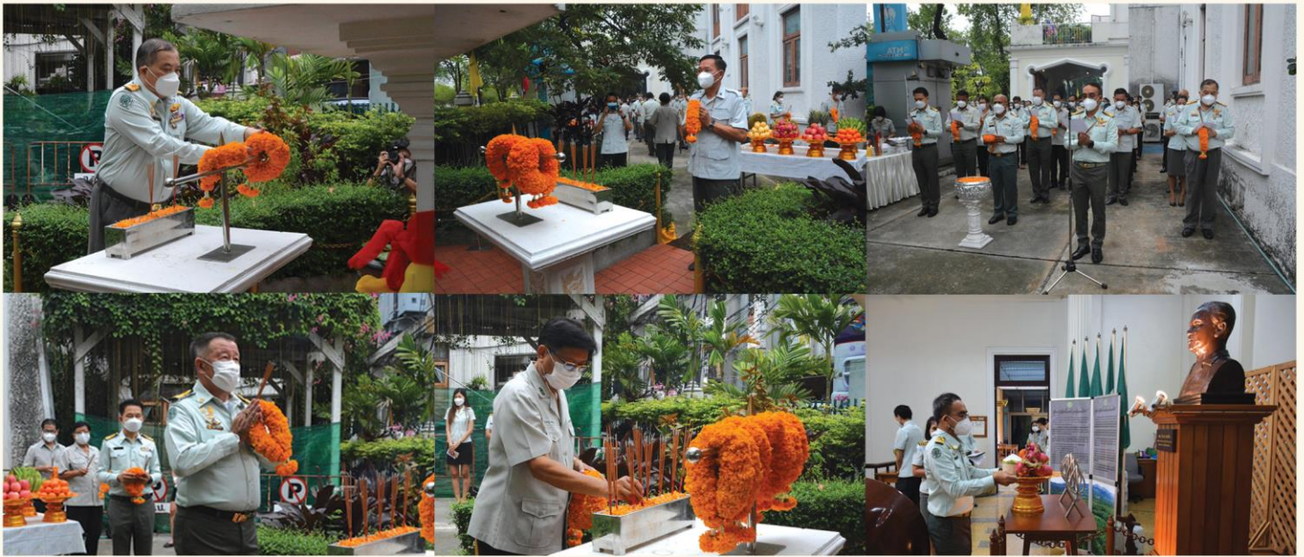
พิธีสักการะศาลพระชัยมงคล