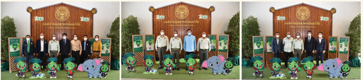
ผู้แทนจากหน่วยงานต่างๆ ร่วมแสดงความยินดี และสมทบทุนการศึกษา