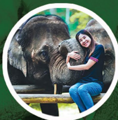
ถ่ายภาพกับช้าง