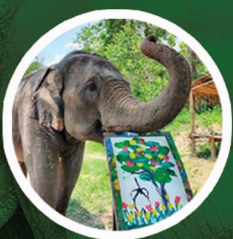
ช้างวาดภาพ