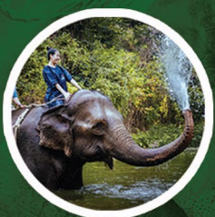
ฝึกเป็นควาญช้าง