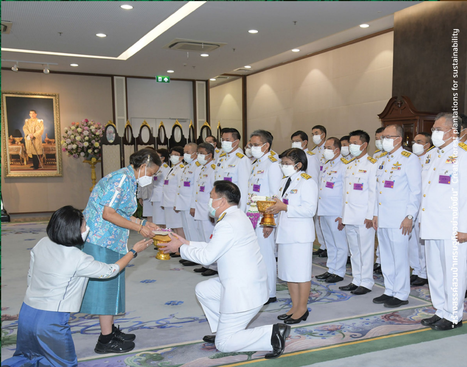
“สร้างผลงานป่าเศรษฐกิจอย่างยั่งยืน” Create forest plantations for sustainability

สมเด็จพระกนิษฐาธิราชเจ้า กรมสมเด็จพระเทพรัตนราชสุดาฯ สยามบรมราชกุมารี พระราชทานพระราชวโรกาส ให้คณะผู้บริหาร ทส. เฝ้าทูลละอองพระบาท