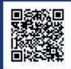
รายละเอียดข่าวประชาสัมพันธ์

นอกจากนี้ พล.ต.อ.พัชรวาท วงษ์สุวรรณ รองนายกรัฐมนตรีและรัฐมนตรีว่าการกระทรวงทรัพยากรธรรมชาติและสิ่งแวดล้อม ได้ร่วมมอบรางวัลการจัดประกวดซุ้มอาหารช้าง และรางวัลความรู้อาหารช้างดีเด่น ประจำปี 2567 พร้อมทั้งร่วมเลี้ยงอาหารช้างบนสะตอกใหญ่ ร่วมกับหัวหน้าส่วนราชการ ตลอดจนหน่วยงานภาครัฐและเอกชนที่ให้การสนับสนุนการจัดงานวันช้างไทยในครั้งนี้ โดยมีช้างเข้าร่วมพิธีมากกว่า 100 เชือก ณ สถาบันคชบาลแห่งชาติ ในพระอุปถัมภ์ฯ อำเภอห้างฉัตร จังหวัดลำปาง