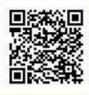
รายละเอียดข่าวประชาสัมพันธ์