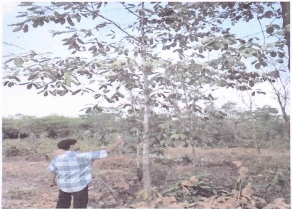
เจ้าหน้าที่สวนป่าขุนหาญ ดำเนินการสำรวจไม้ที่ควรค่าแก่การอนุรักษ์ในพื้นที่และสำรวจพืชุกรานในพื้นที่ไม่พบการกระจายพันธุ์