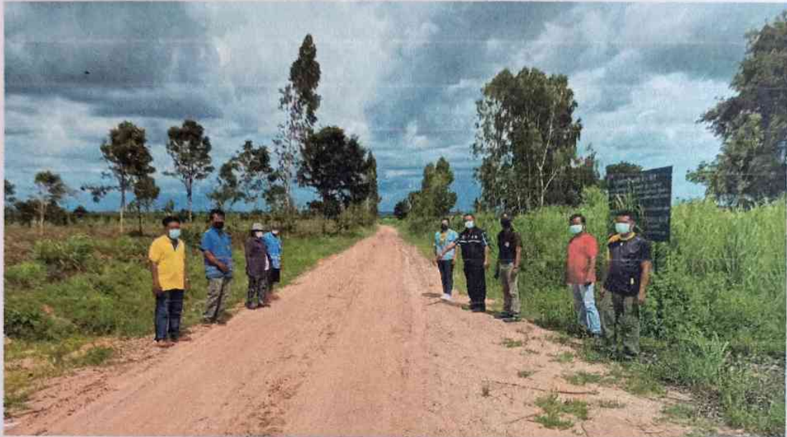
สำรวจเส้นทางระหว่างทำไม้ยูคาลิปตัสและสัมภาษณ์ชาวบ้านที่อาศัยอยู่ใกล้พื้นที่ทำไม้ยูคา