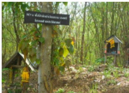
ศาลตลุเชื้อ บริเวณแปลงปี 2524