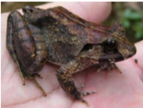
กบภูเขา บริเวณแปลงปี 2523