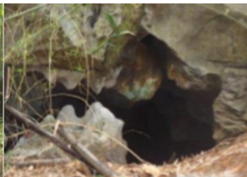
ถ้ำพระ บริเวณแปลงปี 2528