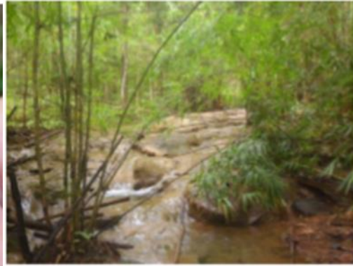
ห้วยอู่ล่อง บริเวณแปลงปี 2521-2524