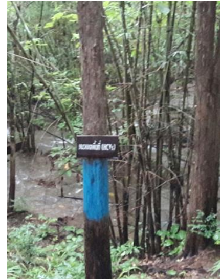
ป้ายแสดงแนวเขตอนุรักษ์

ผลการตรวจติดตาม จากการตรวจติดตาม พื้นที่ HCV ในเขตสวนป่า ไม่พบความเสียหาย และผลกระทบจากการประกอบกิจกรรมของงานสวนป่าเกริงกระเวีย และปัจจัยอื่นๆแต่อย่างใด ห้ามไม่ให้มีการปิดทางน้ำ หรือเปลี่ยนเส้นทางน้ำบริเวณห้วยอุ้งล่อง และในช่วงฤดูฝนจะมีการควบคุมการใช้สารเคมีบริเวณพื้นที่ติดลำห้วยอุ้งล่อง เพื่อป้องกันการเกิดมลพิษทางน้ำ เนื่องจากลำห้วยอุ้งล่องนี้เป็นเส้นทางน้ำ ซึ่งสำคัญต่อการอุปโภคบริโภคของคนในชุมชนท้องถิ่น และเอื้อประโยชน์ต่อสวนป่าอีกด้วย