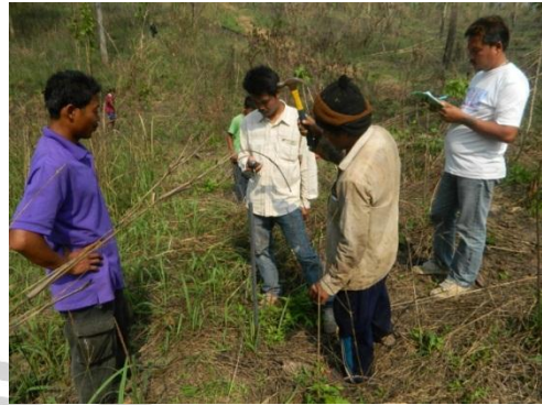
ภาพการตรวจการวัดการพังทลายของดินในพื้นที่สวนป่าทองผาภูมิ