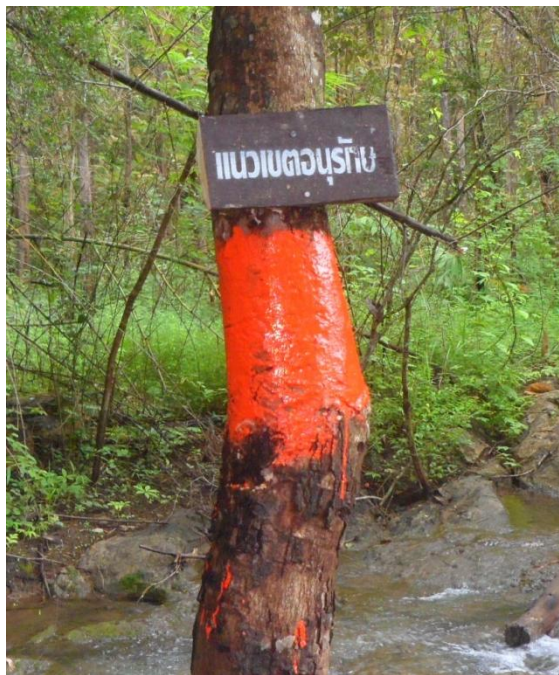
ป้ายแสดงแนวเขตอนุรักษ์บริเวณลำห้วยอุล่อง

ผลการตรวจติดตาม จากการตรวจติดตามพื้นที่ HCV ในเขตสวนป่า ไม่พบความเสียหาย และผลกระทบจากการประกอบกิจกรรมของงานสวนป่าเกริงกระเวีย และปัจจัยอื่นๆแต่อย่างใด ห้ามไม่ให้มีการปิดทางน้ำ หรือเปลี่ยนเส้นทางน้ำบริเวณห้วยอุล่อง และในช่วงฤดูฝนจะมีการควบคุมการใช้สารเคมีบริเวณพื้นที่ติดละห้วยอุล่อง เพื่อป้องกันการเกินมลพิษทางน้ำ เนื่องจากลำห้วยอุล่องนี้เป็นเส้นทางน้ำ ซึ่งสำคัญต่อการอุปโภคบริโภคของคนในชุมชนท้องถิ่น และเอื้อประโยชน์ต่อสวนป่าอีกด้วย