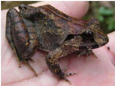
กบภูเขา บริเวณแปลงปี 2523