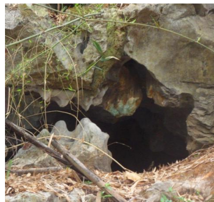
ถ้ำพระ แปลงปี 2528