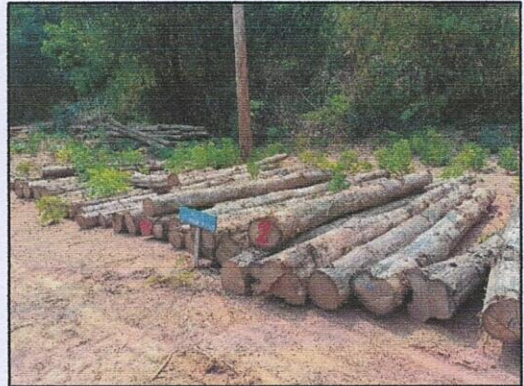
ลำดับที่ 2 กองที่ 2