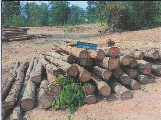
ลำดับที่ 3 กองที่ 3