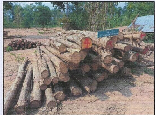
ลำดับที่ 4 กองที่ 4