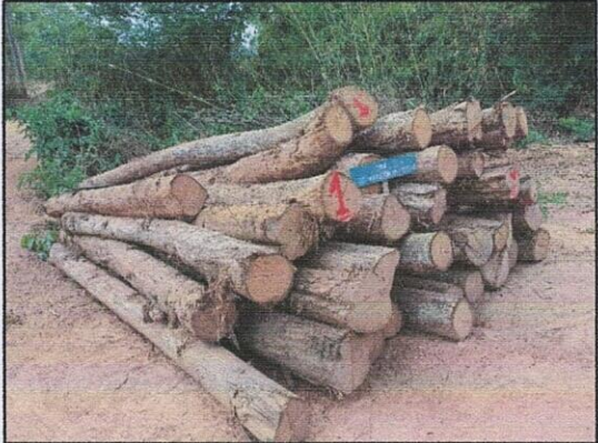
ลำดับที่ 1 กองที่ 1