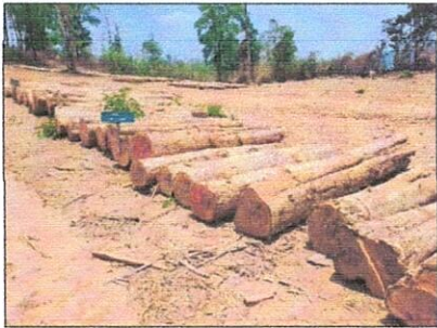
ลำดับที่ 21 กองที่ 21