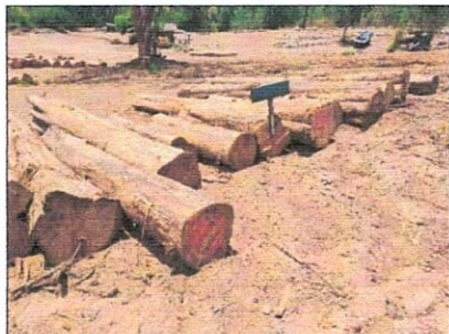
ลำดับที่ 23 กองที่ 23