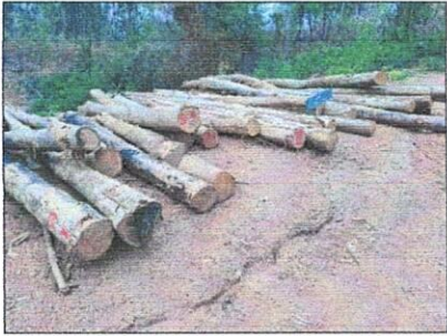
ลำดับที่ 17 กองที่ 17