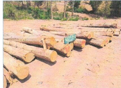
ลำดับที่ 20 กองที่ 20