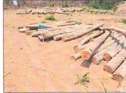
ลำดับที่ 18 กองที่ 18

เป็นไม้ขนาดเล็ก หัวท้ายแตกกร้าว มีปุ่มตา