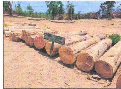
ลำดับที่ 22 กองที่ 22