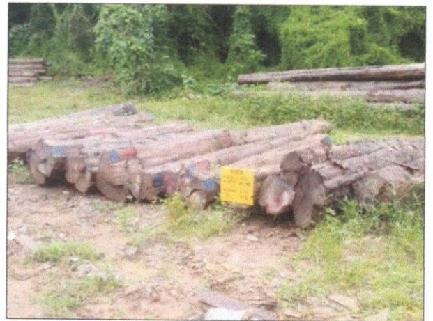
ลำดับที่ 12 สัญลักษณ์กองไม้สักกองที่ 20 ความโต 100-146 ซม. ความยาว 220-620 ซม. จำนวน 18 ท่อน ปริมาตร 6.88 ลบ.ม.