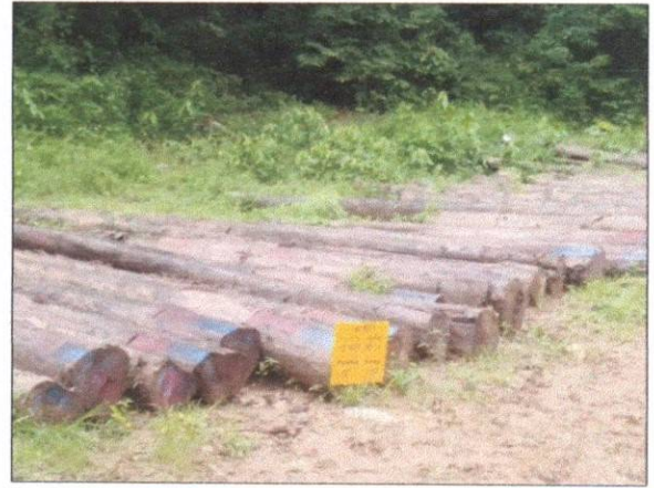
ลำดับที่ 14 สัญลักษณ์กองไม้สักกองที่ 22 ความโต 58-95 ซม. ความยาว 320-620 ซม. จำนวน 46 ท่อน ปริมาตร 11.47 ลบ.ม.