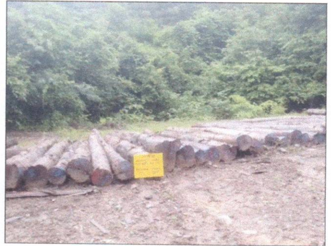
ลำดับที่ 16 สัญลักษณ์กองไม้สักกองที่ 24 ความโต 57-99 ซม. ความยาว 320-620 ซม. จำนวน 45 ท่อน ปริมาตร 10.93 ลบ.ม.