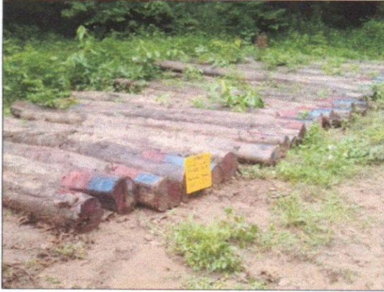
ลำดับที่ 13 สัญลักษณ์กองไม้สักกองที่ 21 ความโต 59-99 ซม. ความยาว 320-620 ซม. จำนวน 46 ท่อน ปริมาตร 11.35 ลบ.ม.