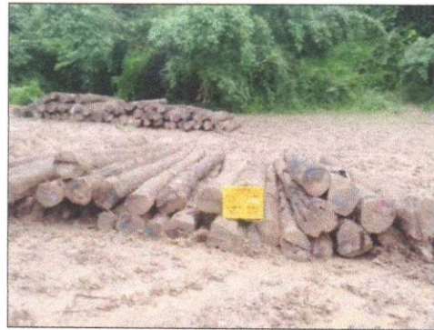
ลำดับที่ 2 สัญลักษณ์กองไม้สักกองที่ 8 ความโต 59-98 ซม. ความยาว 620 ซม. จำนวน 36 ท่อน ปริมาตร 12.09 ลบ.ม.