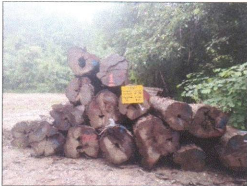
ลำดับที่ 1 สัญลักษณ์กองไม้สักกองที่ 1 ความโต 149-230 ซม. ความยาว 200-620 ซม. จำนวน 16 ท่อน ปริมาตร 12.19 ลบ.ม.

ท้องที่ตำบลห้วยโรง อำเภอร้องกวาง จังหวัดแพร่ (งวดที่ 2 ครั้งที่ 2) จำนวน 19 กอง