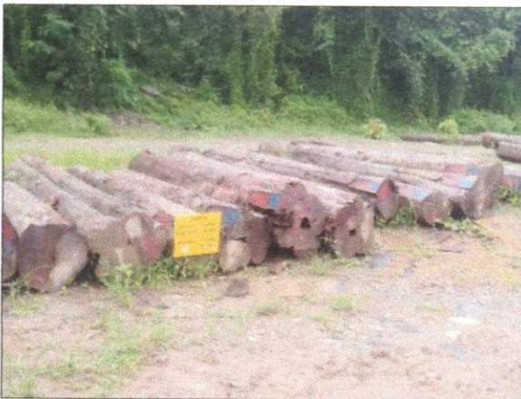
ลำดับที่ 11 สัญลักษณ์กองไม้สักกองที่19 ความโต 100-151 ซม. ความยาว 220-620 ซม. จำนวน 31 ท่อน ปริมาตร 13.59 ลบ.ม.