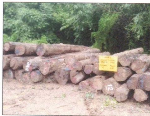
ลำดับที่ 4 สัญลักษณ์กองไม้สักกองที่ 11 ความโต 57-97 ซม. ความยาว 320-610 ซม. จำนวน 56 ท่อน ปริมาตร 12.11 ลบ.ม.