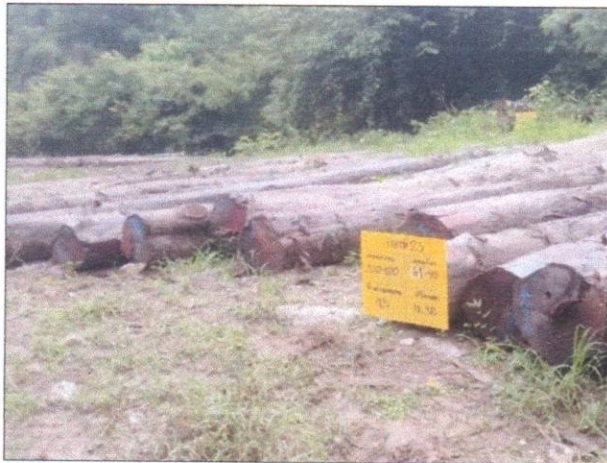
ลำดับที่ 15 สัญลักษณ์กองไม้สักกองที่ 23 ความโต 61-99 ซม. ความยาว 320-620 ซม. จำนวน 45 ท่อน ปริมาตร 11.38 ลบ.ม.