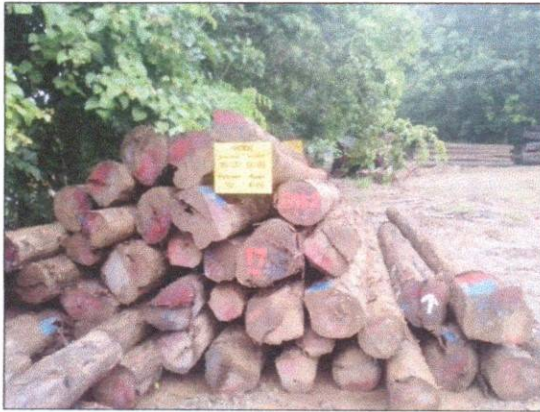
ลำดับที่ 9 สัญลักษณ์กองไม้สักกองที่16 ความโต 64-98 ซม. ความยาว 310-570 ซม. จำนวน 52 ท่อน ปริมาตร 10.86 ลบ.ม.