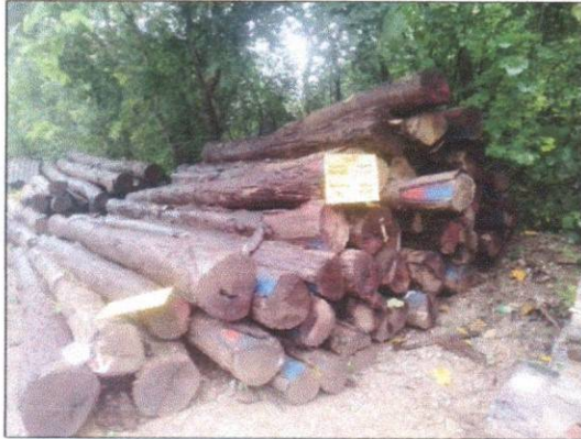
ลำดับที่ 20 สัญลักษณ์กองไม้กระยาเลยกองที่ 1