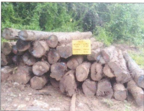
ลำดับที่ 3 สัญลักษณ์กองไม้สักกองที่ 9 ความโต 57-104 ซม. ความยาว 620 ซม. จำนวน 37 ท่อน ปริมาตร 12.30 ลบ.ม.