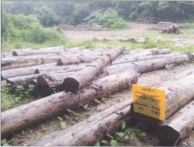
ลำดับที่ 17 สัญลักษณ์กองไม้สักกองที่ 25 ความโต 56-99 ซม. ความยาว 320-620 ซม. จำนวน 45 ท่อน ปริมาตร 9.85 ลบ.ม.