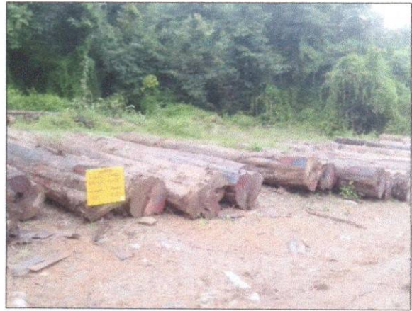
ลำดับที่ 10 สัญลักษณ์กองไม้สักกองที่ 18 ความโต 101-132 ซม. ความยาว 220-620 ซม. จำนวน 28 ท่อน ปริมาตร 12.65 ลบ.ม.