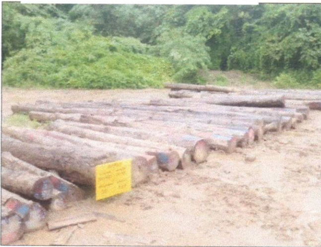
ลำดับที่ 19 สัญลักษณ์กองไม้สักกองที่ 27 ความโต 55-98 ซม. ความยาว 320-620 ซม. จำนวน 58 ท่อน ปริมาตร 11.29 ลบ.ม.