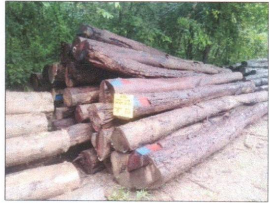
ลำดับที่ 21 สัญลักษณ์กองไม้กระยาเลยกองที่ 2