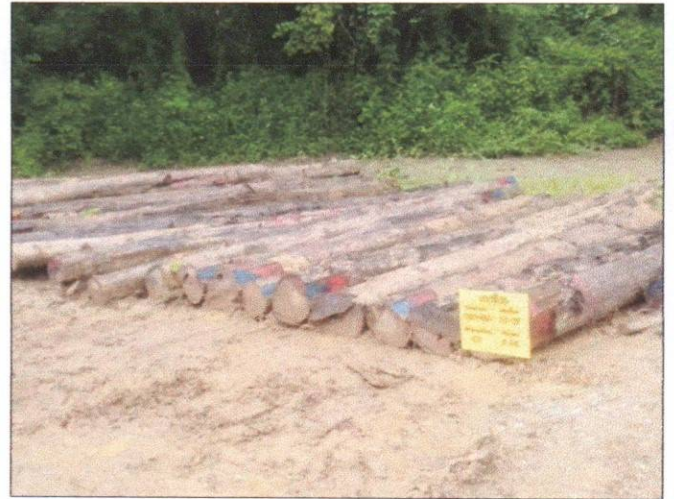
ลำดับที่ 18 สัญลักษณ์กองไม้สักกองที่ 26 ความโต 59-99 ซม. ความยาว 320-620 ซม. จำนวน 42 ท่อน ปริมาตร 11.64 ลบ.ม.