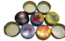
ฝาเครื่องดื่มแบบพาคัลยว