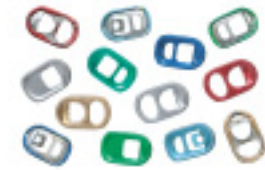
ห่วงจากกรป่องเครื่องดื่ม