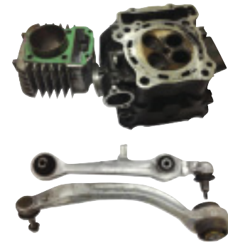
ชิ้นส่วนจากเครื่องจักรหรือมีผลจากรถยนต์

ขาเทียม กับอะลูมิเนียม เกี่ยวข้องกัน อย่างไร