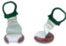
ห่วงจากพาน้ำดื่ม