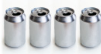
กรป่องน้ำอัดลม