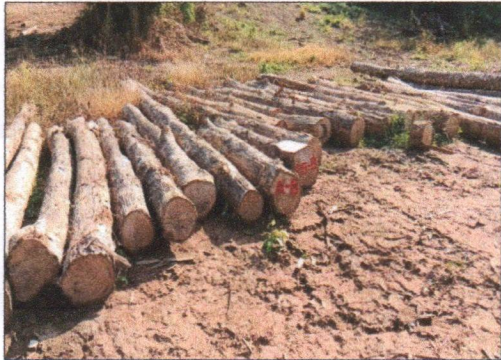
ลำดับที่ 1 กองที่ 1