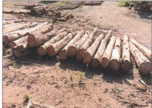
ลำดับที่ 2 กองที่ 2