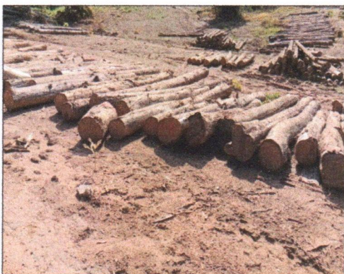
ลำดับที่ 3 กองที่ 3