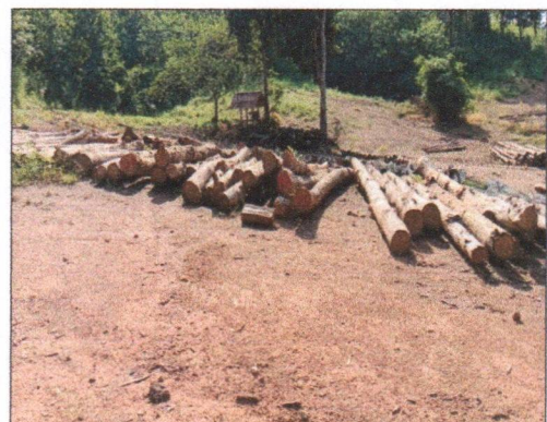
ลำดับที่ 4 กองที่ 4