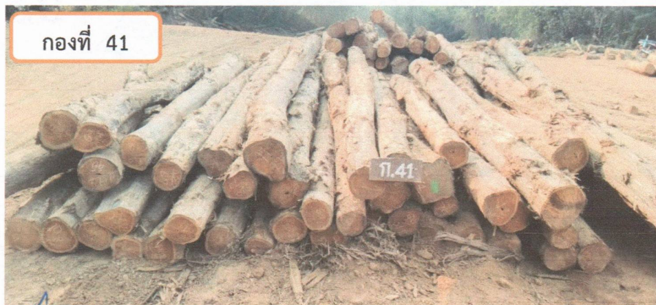
กองที่ 41 ความยาว 300-470 ม. ความโต 60-79 ซม. จำนวน 55 ท่อน ปริมาตร 6.53 ลบ.ม. ราคากรรมการกำหนด 48,400.00 บาท

(Handwritten signatures and scribbles in blue ink are present below the caption for pile 41, including a large signature on the left and another on the right.)