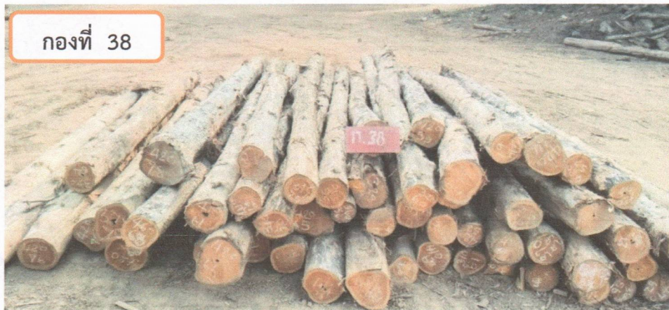
กองที่ 38 ความยาว 300-470 ม. ความโต 50-79 ซม. จำนวน 60 ท่อน ปริมาตร 6.53 ลบ.ม. ราคากรรมการกำหนด 43,000.00 บาท