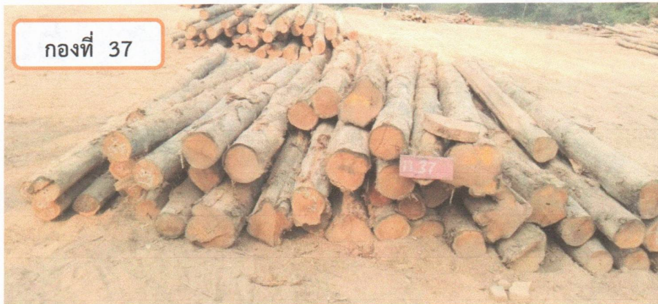
กองที่ 37 ความยาว 300-460 ม. ความโต 50-79 ซม. จำนวน 48 ท่อน ปริมาตร 6.54 ลบ.ม. ราคากรรมการกำหนด 51,600.00 บาท