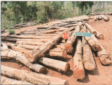
ลำดับที่ 11 กองที่ 11