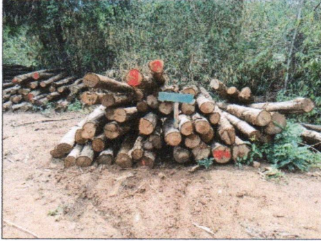
ลำดับที่ 9 กองที่ 9