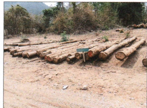
ลำดับที่ 12 กองที่ 12