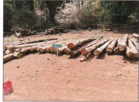
ลำดับที่ 10 กองที่ 10