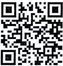
บัญชีไม้