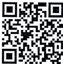
รูปภาพไม้