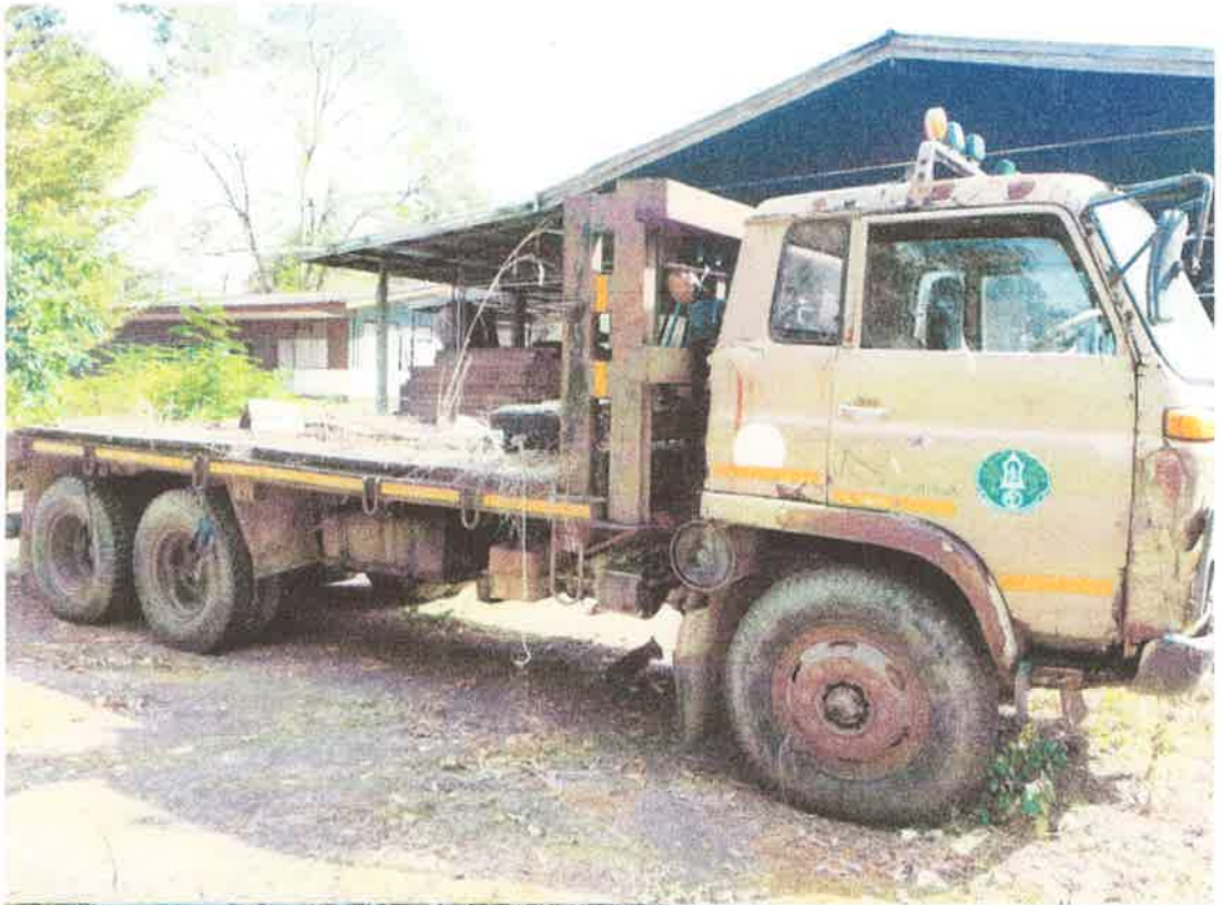
รถยนต์กระบะบรรทุก ๑๐ ล้อ หมายเลขทะเบียน ๘๑ - ๓๘๒๘ พิษณุโลก