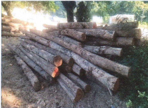
ลำดับที่ 13 กองที่ 13 ความโต 50-69 ซม. ความยาว 200-620 ซม. จำนวน 49 ท่อน ปริมาตร 6.09 ลบ.ม. ราคาที่กำหนดรวมภาษี 61,900.-บาท เป็นไม้ขนาดกลาง หัวท้ายคดงอ มีปมตา