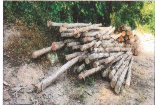
ลำดับที่ 14 กองที่ 14 ความโต 30-49 ซม. ความยาว 210-620 ซม. จำนวน 83 ท่อน ปริมาตร 5.63 ลบ.ม. ราคาที่กำหนดรวมภาษี 33,300.-บาท เป็นไม้ขนาดเล็ก หัวท้ายคดงอ มีปมตา