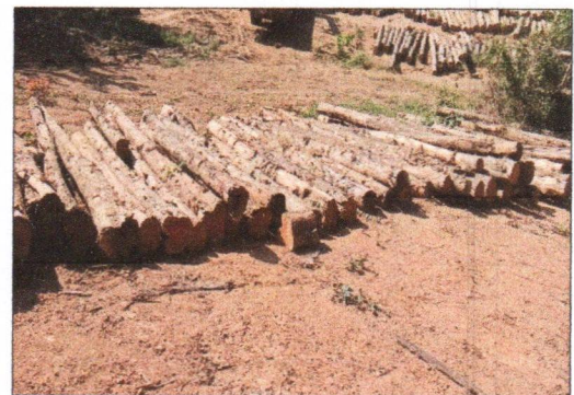
ลำดับที่ 8 กองที่ 8