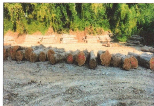
ลำดับที่ 16 กองที่ 16 ความโต 101-171 ซม. ความยาว 320-420 ซม. จำนวน 14 ท่อน ปริมาตร 5.91 ลบ.ม. ราคาที่กำหนดรวมภาษี 175,700.-บาท เป็นไม้ขนาดใหญ่ ตรง คุณภาพดี