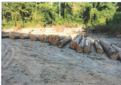
ลำดับที่ 15 กองที่ 15 ความโต 101-162 ซม. ความยาว 320-420 ซม. จำนวน 15 ท่อน ปริมาตร 6.07 ลบ.ม. ราคาที่กำหนดรวมภาษี 170,100.-บาท เป็นไม้ขนาดใหญ่ ตรง คุณภาพดี