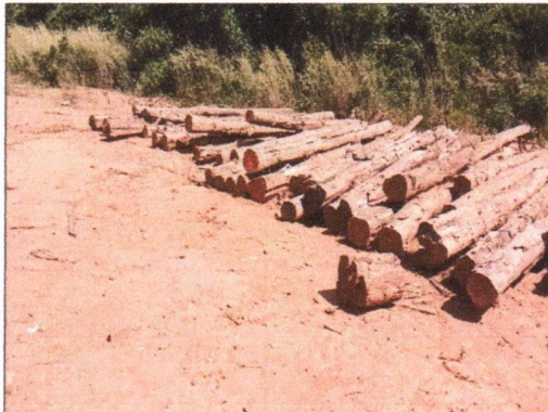
ลำดับที่ 5 กองที่ 5