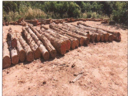
ลำดับที่ 6 กองที่ 6