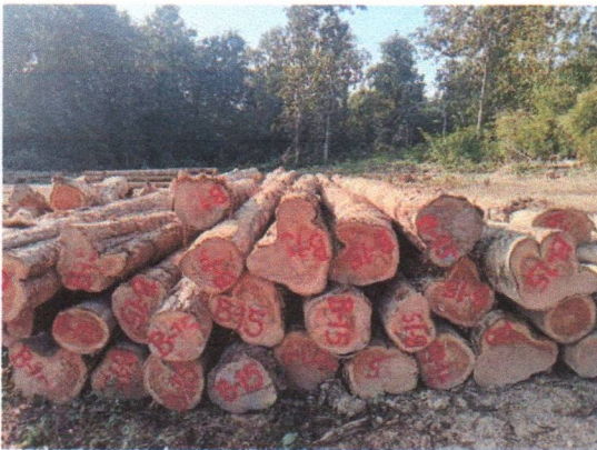
กองที่ 15 รหัส MH-B15

จำนวน...60...ท่อน ปริมาตร.....6.59...ลบ.ม. คณะกรรมการกำหนด.....54,500...บาท