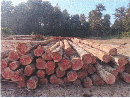
กองที่ 17 รหัส MH-B17

จำนวน...60...ท่อน ปริมาตร.....6.99...ลบ.ม. คณะกรรมการกำหนด.....59,200.....บาท