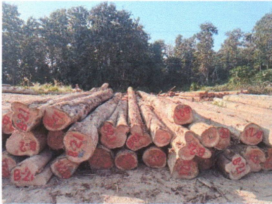
กองที่ 21 รหัส MH-B21

จำนวน...35...ท่อน ปริมาตร...6.24...ลบ.ม. คณะกรรมการกำหนด...79,800...บาท