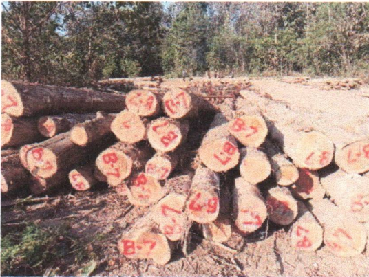
กองที่ 7 รหัส MH-B7

จำนวน...40...ท่อน ปริมาตร.....6.63...ลบ.ม. คณะกรรมการกำหนด.....83,100...บาท