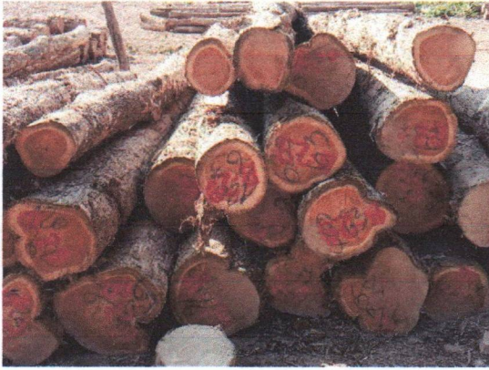
กองที่ 29 รหัส MH-B29

องค์การอุตสาหกรรมป่าไม้เขตแพร่ แปลงปี 2542/2517 งวดที่ 1/2568