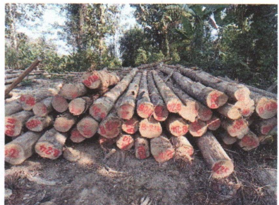
กองที่ 24 รหัส MH-B24

จำนวน...55...ท่อน ปริมาตร...6.55...ลบ.ม. คณะกรรมการกำหนด...56,700...บาท