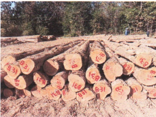
กองที่ 31 รหัส MH-B31

จำนวน...60...ท่อน ปริมาตร.....6.77...ลบ.ม. คณะกรรมการกำหนด.....57,800.....บาท