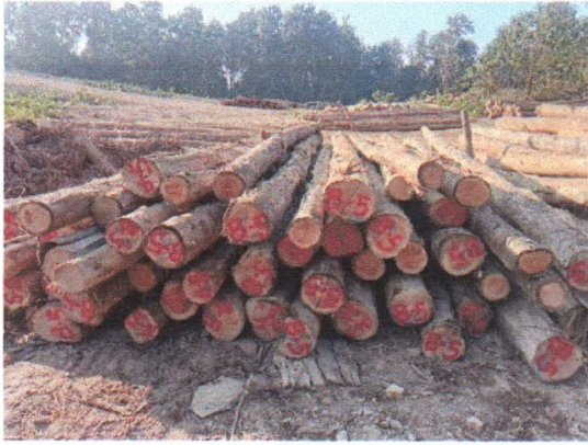
กองที่ 5 รหัส MH-B5

จำนวน...60...ท่อน ปริมาตร.....6.82...ลบ.ม. คณะกรรมการกำหนด.....57,300...บาท