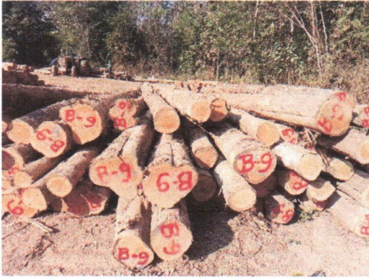
กองที่ 9 รหัส MH-B9

จำนวน...60...ท่อน ปริมาตร.....6.55...ลบ.ม. คณะกรรมการกำหนด.....54,000.....บาท