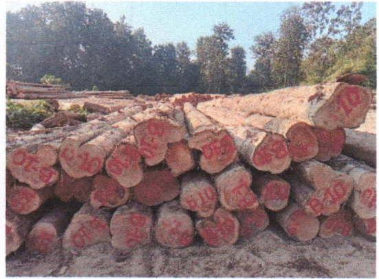
กองที่ 10 รหัส MH-B10

จำนวน...60...ท่อน ปริมาตร.....6.55...ลบ.ม. คณะกรรมการกำหนด.....54,000.....บาท