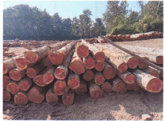
กองที่ 30 รหัส MH-B30

จำนวน...35...ท่อน ปริมาตร.....6.28...ลบ.ม. คณะกรรมการกำหนด.....81,300.....บาท