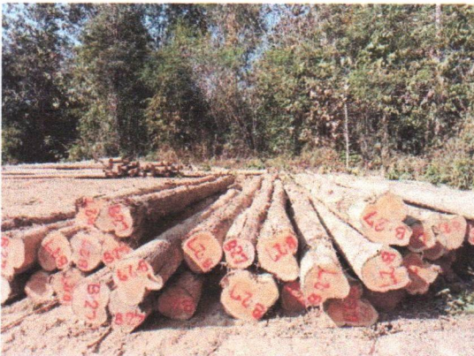
กองที่ 27 รหัส MH-B27

จำนวน...60...ท่อน ปริมาตร.....6.69...ลบ.ม. คณะกรรมการกำหนด.....55,700...บาท