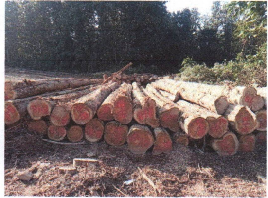
กองที่ 18 รหัส MH-B18

จำนวน...60...ท่อน ปริมาตร.....6.99...ลบ.ม. คณะกรรมการกำหนด.....59,200.....บาท