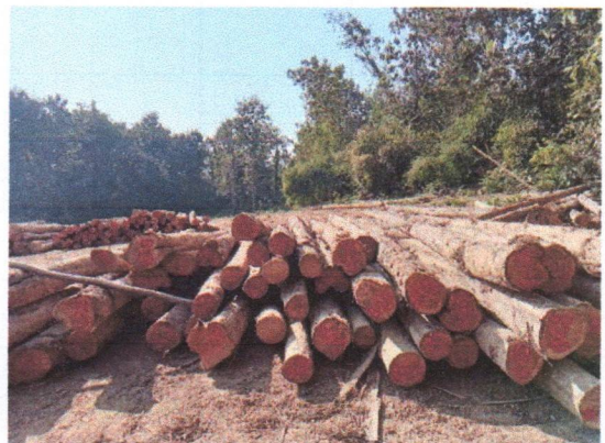
กองที่ 28 รหัส MH-B28

จำนวน...40...ท่อน ปริมาตร.....6.70...ลบ.ม. คณะกรรมการกำหนด.....84,700...บาท