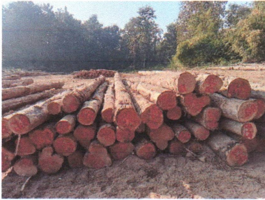
กองที่ 13 รหัส MH-B13

องค์การอุตสาหกรรมป่าไม้เขตแพร่ แปลงปี 2542/2517 งวดที่ 1/2568