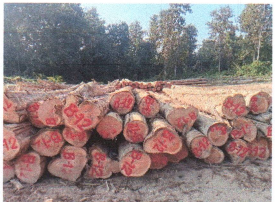
กองที่ 12 รหัส MH-B12

จำนวน...60...ท่อน ปริมาตร.....6.41...ลบ.ม. คณะกรรมการกำหนด.....51,900.....บาท