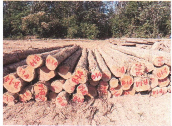
กองที่ 14 รหัส MH-B14

จำนวน...60...ท่อน ปริมาตร.....6.62...ลบ.ม. คณะกรรมการกำหนด.....55,300...บาท