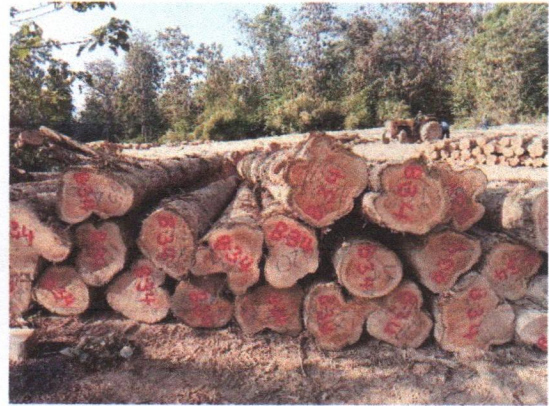
กองที่ 33 รหัส MH-B33

จำนวน...60...ท่อน ปริมาตร.....6.98...ลบ.ม. คณะกรรมการกำหนด.....58,100.....บาท