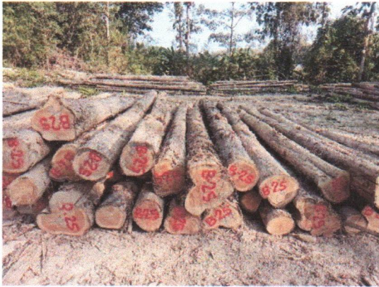
กองที่ 25 รหัส MH-B25

จำนวน...35...ท่อน ปริมาตร.....6.25...ลบ.ม. คณะกรรมการกำหนด.....80,900...บาท