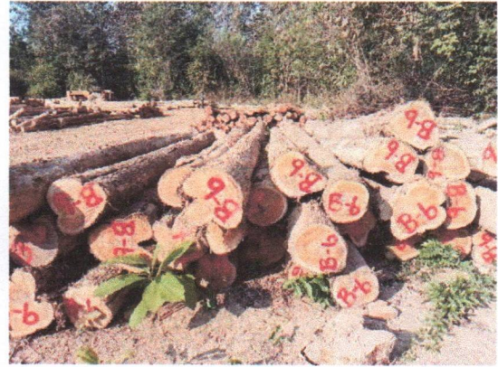
กองที่ 6 รหัส MH-B6

จำนวน...60...ท่อน ปริมาตร.....6.82...ลบ.ม. คณะกรรมการกำหนด.....57,300...บาท