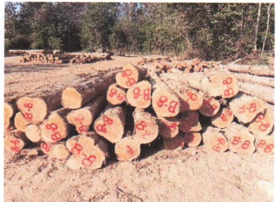
กองที่ 8 รหัส MH-B8

จำนวน...60...ท่อน ปริมาตร.....6.80...ลบ.ม. คณะกรรมการกำหนด.....57,000...บาท