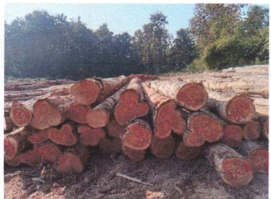
กองที่ 32 รหัส MH-B32

จำนวน...35...ท่อน ปริมาตร.....6.28...ลบ.ม. คณะกรรมการกำหนด.....80,800.....บาท