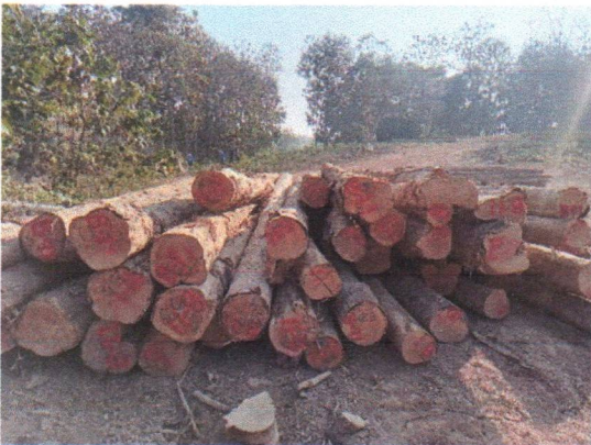
กองที่ 11 รหัส MH-B11

จำนวน...40...ท่อน ปริมาตร.....6.80...ลบ.ม. คณะกรรมการกำหนด.....85,000.....บาท