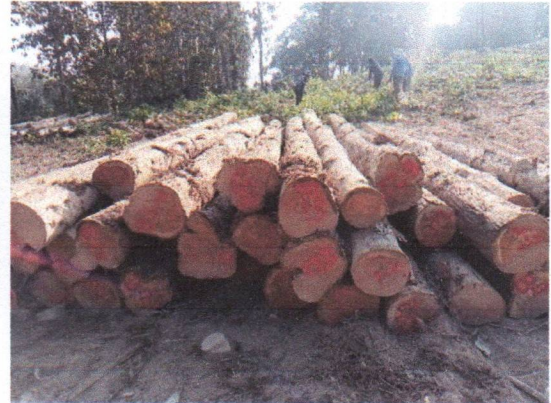
กองที่ 22 รหัส MH-B22

จำนวน...35...ท่อน ปริมาตร...6.24...ลบ.ม. คณะกรรมการกำหนด...79,800...บาท