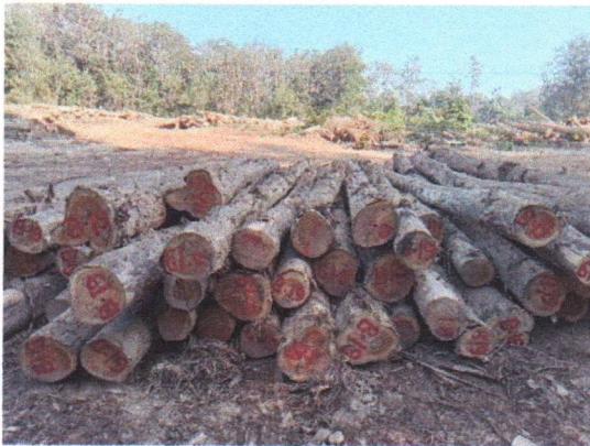
กองที่ 19 รหัส MH-B19

จำนวน...35...ท่อน ปริมาตร.....6.32...ลบ.ม. คณะกรรมการกำหนด.....81,900.....บาท