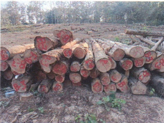
กองที่ 3 รหัส MH-B3

จำนวน...35...ท่อน ปริมาตร.....6.42...ลบ.ม. คณะกรรมการกำหนด.....82,600...บาท