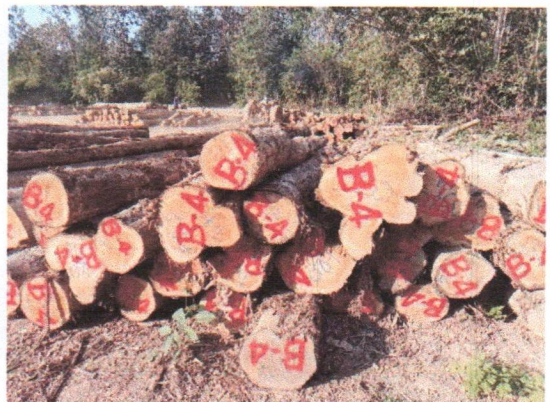
กองที่ 4 รหัส MH-B4

จำนวน...60...ท่อน ปริมาตร.....6.33...ลบ.ม. คณะกรรมการกำหนด.....51,300...บาท