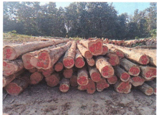
กองที่ 20 รหัส MH-B20

จำนวน...55...ท่อน ปริมาตร.....6.53...ลบ.ม. คณะกรรมการกำหนด.....56,900.....บาท