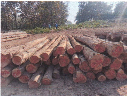
กองที่ 23 รหัส MH-B23

จำนวน...40...ท่อน ปริมาตร...6.66...ลบ.ม. คณะกรรมการกำหนด...82,800...บาท