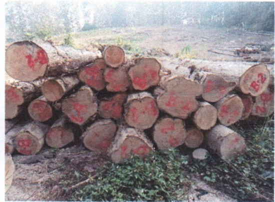
กองที่ 2 รหัส MH-B2

จำนวน...55...ท่อน ปริมาตร.....6.69...ลบ.ม. คณะกรรมการกำหนด.....57,200...บาท