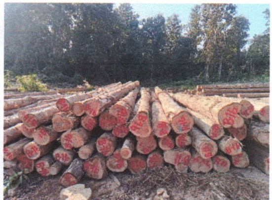
กองที่ 16 รหัส MH-B16

จำนวน...35...ท่อน ปริมาตร.....6.56...ลบ.ม. คณะกรรมการกำหนด.....87,100...บาท