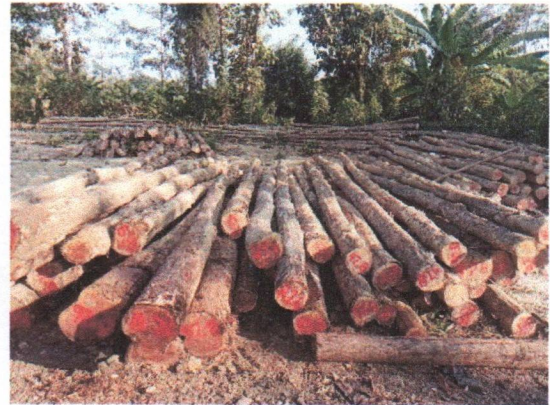
กองที่ 26 รหัส MH-B26

จำนวน...35...ท่อน ปริมาตร.....6.25...ลบ.ม. คณะกรรมการกำหนด.....80,900...บาท