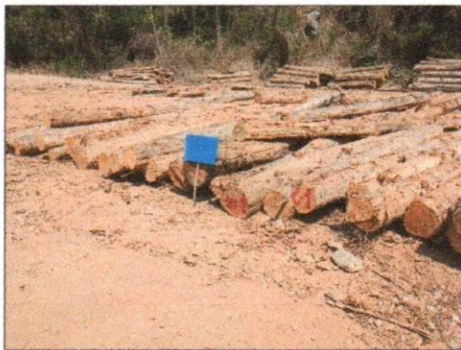
ลำดับที่ 3 กองที่ 3