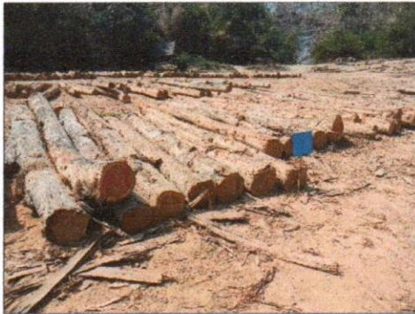
ลำดับที่ 1 กองที่ 1