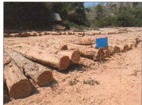
ลำดับที่ 4 กองที่ 4