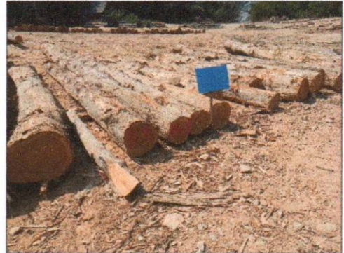
ลำดับที่ 2 กองที่ 2